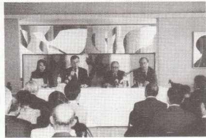
発言するG.モンターニュ大使

集いは午前中、G. モンターニュ大使から全国の日仏協会の活動への感謝と、政治・経済・文化面など広く最近の日仏関係についてのスピーチ、本野・元駐仏大使の日仏交流の歴史についてのスピーチに続き、各協会から交流活動の特徴や現在かかえている課題などについて次々と発言がありました。そして大使主催によるビュッフェ形式の昼食のあと、会場を恵比寿の日仏会館に移して、1. 文化、2. 日仏経済関係、3. 社会・教育の三つの分科会で中身の濃い討議が行われ、午後4時半澄田理事長の挨拶で閉会しました。